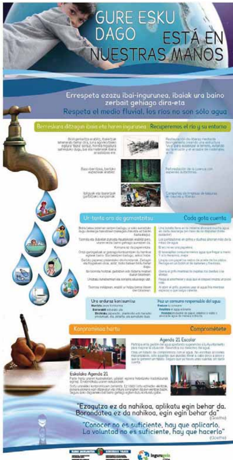
Este panel plantea soluciones para mejorar el daño causado en los ecosistemas fluviales.